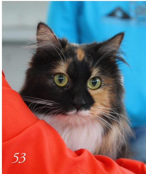
Zumba Magical lynx Femelle Neutre Black Tortie Smoke et Blc ans et 4 mois Best In Show femelle neutre 9ième chat du Top Ten

Par exemple, la texture de la fourrure n'est pas décrite dans le standard LOOF (5 points dans le standard LOOF pour 10 points dans le standard TICA) uniquement la texture.