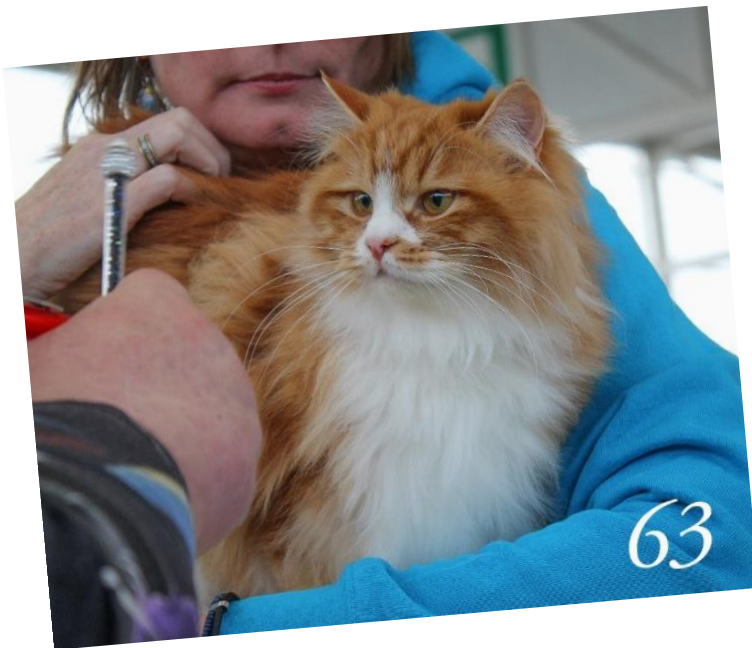
Success Full Grace Kelly des Kurilian Breish Red Blotched tabby et Blc Femelle 1 ans et 5 mois