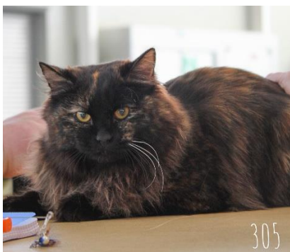
Best in Show 6/10 femelle 4ième du top ten