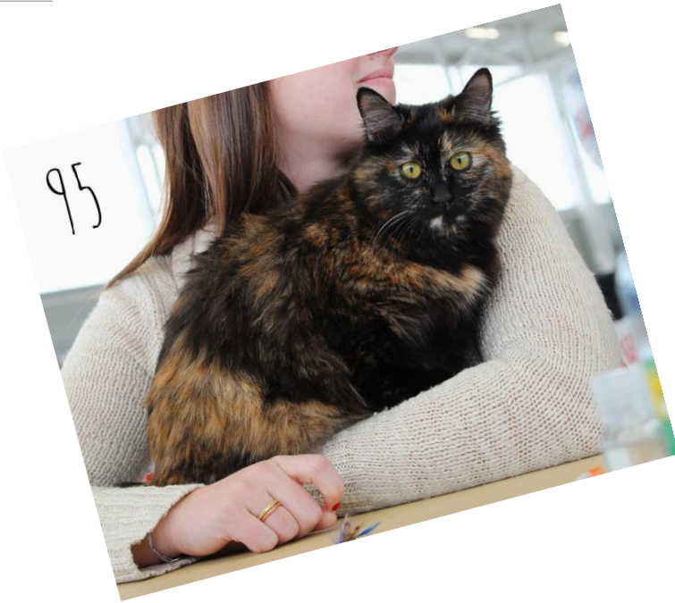
Tsarine Des SimplycatBlack Toirtie Femelle 8 mois et 24 jours