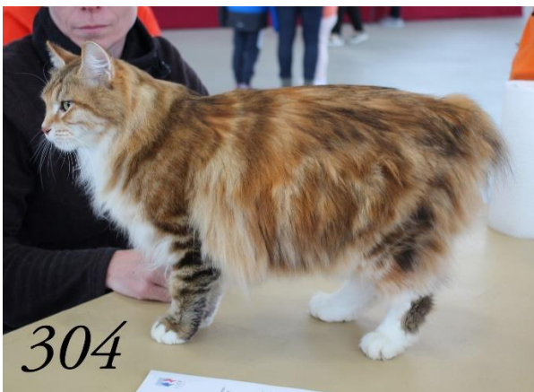
6 ème du Top Ten

Flavia of Planète Lumens Femelle 3 ans et 8 mois Brown Tortie copal blotched Tabby et Blc