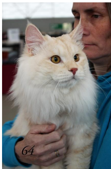
2 nd Best du top ten