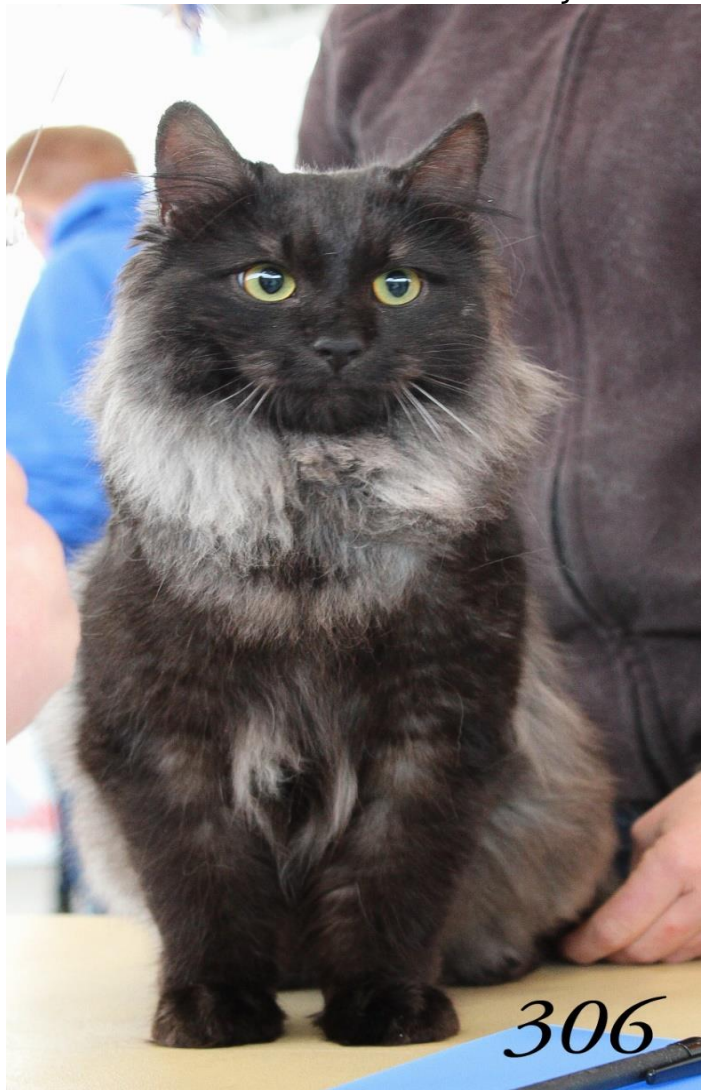
Best femelle, 3ieme du Top Ten