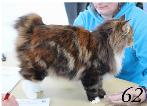
5ième du Top Ten