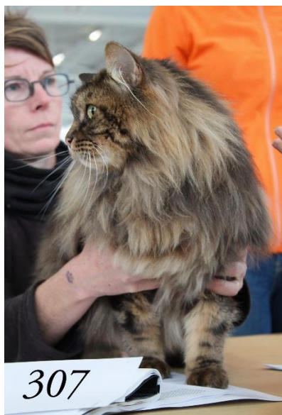
Best of best, best du top ten, best in show male