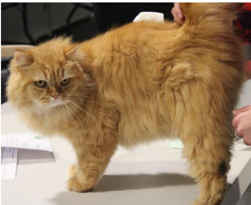
Chat n° 1041 : Meilleur AE