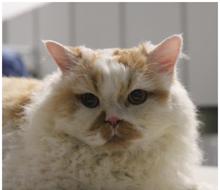
Chat n° 1042

La fourrure est dense et pelucheuse, les boucles sont régulières. Les longhairs présentent une fourrure légèrement plus longue et également bien bouclée dans la majorité des cas.