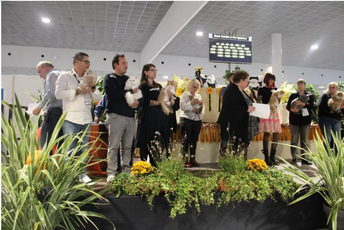
Podium en formation : de gauche à droite : chats n° 1045, 122, 1091, 1152, 127, 1052, 1177, 1033