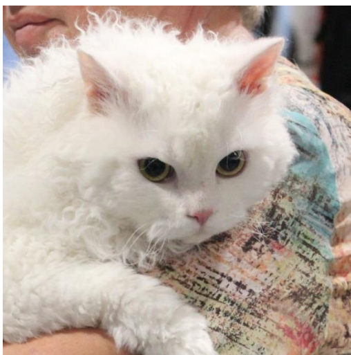
Chat n° 122

Comparaison des deux standards sur les points les plus essentiels (en surbrillance, les points que j'estime communs).